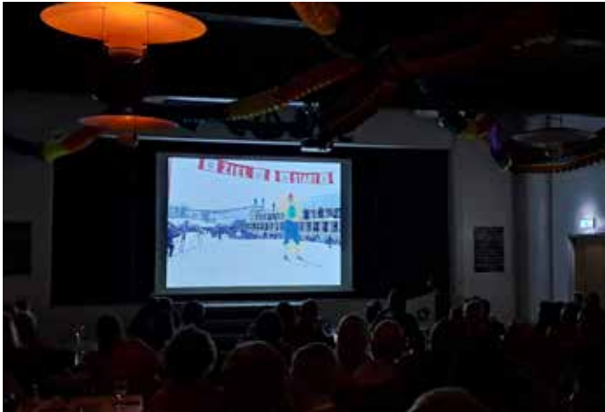
Sport, Filmkunst und Nostalgie pur begeisterte die Gäste.