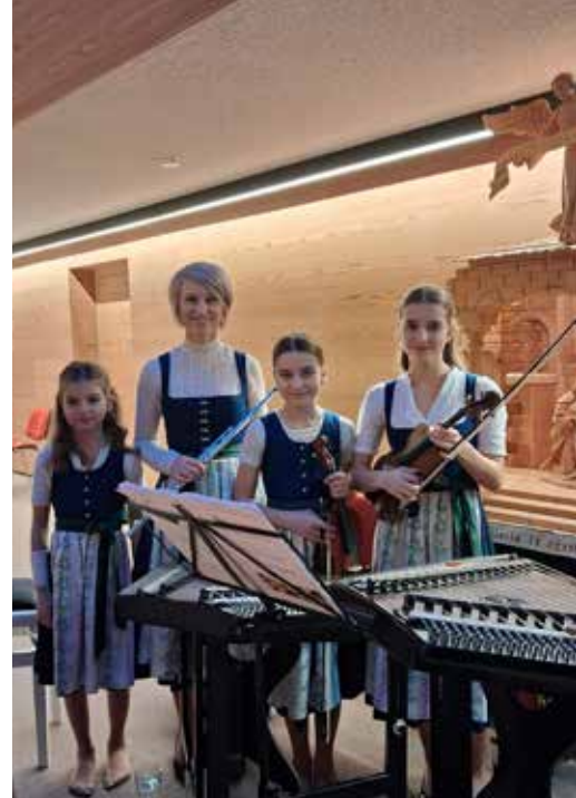
Familie Plankensteiner beim Weihnachtskonzert.