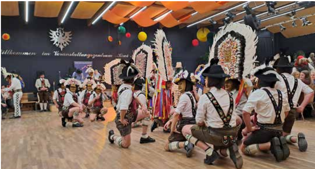
Ein starker Auftritt der Spiegeltuxer und Hiätler beim Absamer Matschgererschaugn.