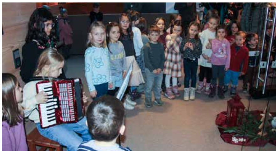
Der Oswald-Milser-Kinderchor erfreute Bewohner:innen und Eltern.