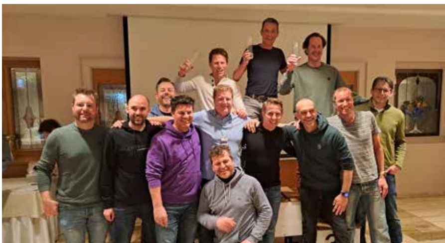
Alles Sieger in der anzahlmäßig größten Klasse: Die Herren der Klasse AK2.

Gratulation an alle Teilnehmer:innen! Ein großes Danke ergeht an den Schiclub Mils für die professionelle Durchführung im Auftrag der Gemeinde Mils, an die Glungezerbahnen und den TVB Region Hall-Wattens für den Gratis-Skitag, die Bergrettung, den Reschenhof, und an die Skischule Tostal und Matadorworld Innsbruck für die Bereitstellung der Preise für die Familienwertung.