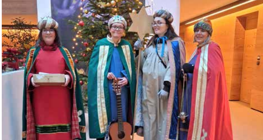
Die Sternsinger sind jedes Jahr herzlich willkommen.